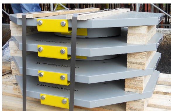
SERIE ERGOFLON DISC